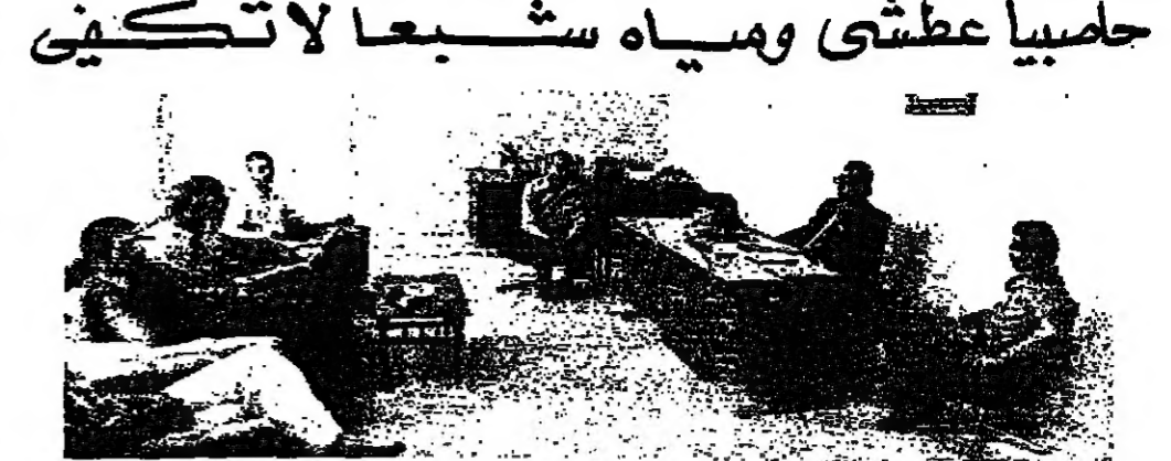
الماء يستعمل للشرب وللغسيل واحد في وقت

صيدا - من مراسل «الانوار» : حوث لبنان الأخيرة، عذلت الجنوب اكثر من اي وقت عن الاهتمام الرسمي حتى بات الحديث عن حرمان قري الجنوب حديثاً في غير محله. لكن مجرد تجاهل المشكلة لا يظلم والحيارة تأسس على الجنوبيين نسي ظل الوضع الراهن والأعمال الملامق لقرام.